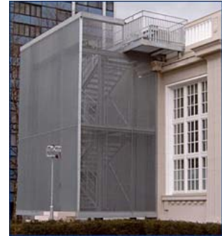
Treppenanlage Hamburg Gitterroste zur Sicherungseinzäunung einer Treppenanlage