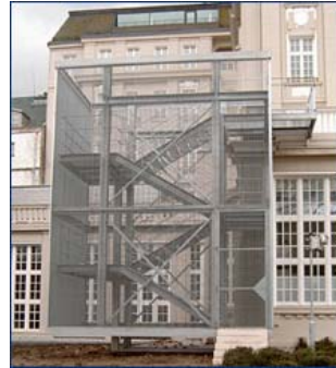
Treppenanlage Hamburg Gitterroste zur Sicherungseinzäunung einer Treppenanlage