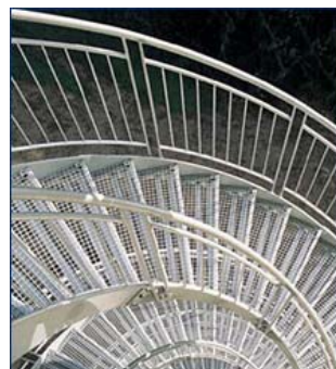
Wendeltreppe mit Gitterroststufen und Sicherheitsgeländer