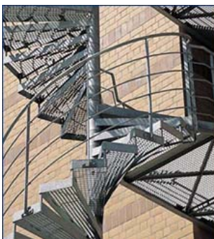
Spindeltreppe mit Eingangssicherung, Belag Gitterroste feuerverzinkt