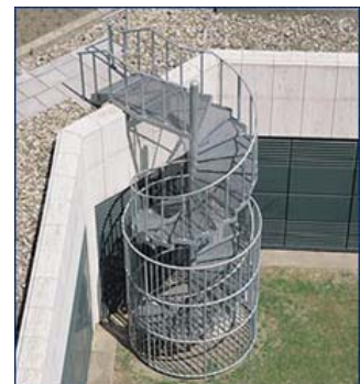
Spindeltreppe TUI Hannover