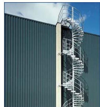
Spindeltreppe mit einem Austrittspodest, zwei Ruhepodesten und seitlichen Streben