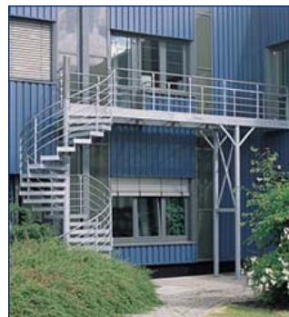
Spindeltreppe am Flughafen Hannover