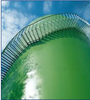
Tankmanteltreppe als einwangige Wendeltreppe, die Wange ist der Tank